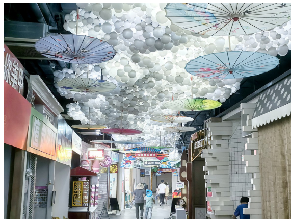
“国潮”范十足的古镇秀街集市。