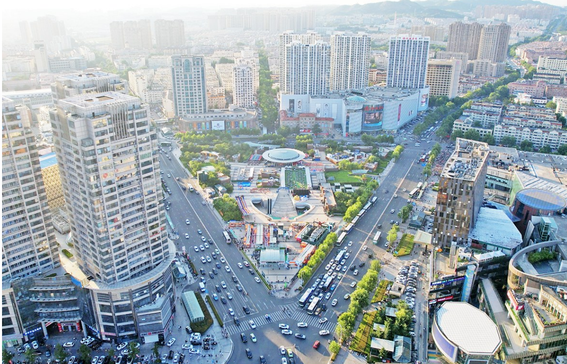
热闹繁华的李村商圈。

今年以来,青岛的商业版图迎来了新一轮变化:有商场已开工建设,即将成为新片区的地标性建筑;部分商场开始转身,寻找新的发展机会。近日,记者在夏庄路、京口路等地探访时了解到,拥有上百年历史的胶东第一商圈——李村商圈,也在悄然发生着变化。在这轮变化中,也将迎来新机遇。