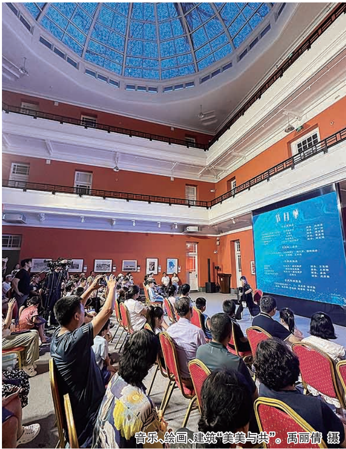
音乐、绘画、建筑“美美与共”。

在音乐、绘画、建筑的艺术互动中，探索跨界融合、更加多元时尚的可能。“乐动红墙”在老城的文化底蕴里，迸发出全新的艺术活力。