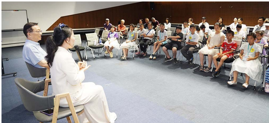
青岛晚报小记者与钢琴大师面对面。