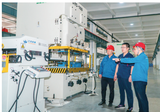
国网黄岛区供电公司工作人员到海容冷链生产车间进行安全用电检查工作。