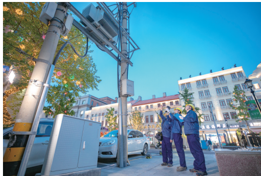
国网青岛供电公司工作人员在中山路片区巡视。

从增长贡献率来看,计算机、通信和其他设备制造业、化学原料和化学制品制造业对全市用电量增长贡献率超过7%。计算机、通信和其他设备制造业上半年用电量8.09亿千瓦时,同比增长40.63%,对全社会用电量的增长贡献率达到7.26%。该领域用电量的快速增长得益于青岛制造业企业纷纷向工业互联网转型。2024年以来,青岛市发布“工业赋能”“未来城市”场景超5000个,每年推动1000家企业开展数字化改造,全力打造“一超多专”工业互联网平台体系,培育出4个全球“灯塔工厂”、14个全国工业互联网平台,均居副省级城市首位。