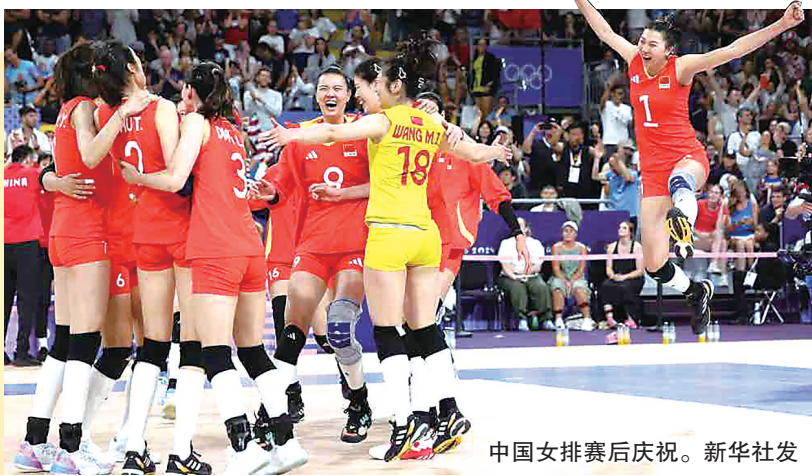
中国女排赛后庆祝。

中国红闪耀巴黎!北京时间7月30日凌晨,在巴黎奥运会女排A组小组赛中,中国队3:2险胜东京奥运会冠军美国队,赢得“开门红”。中国女排主教练蔡斌说:“一场一场来,(奥运)比赛才刚刚开始!”