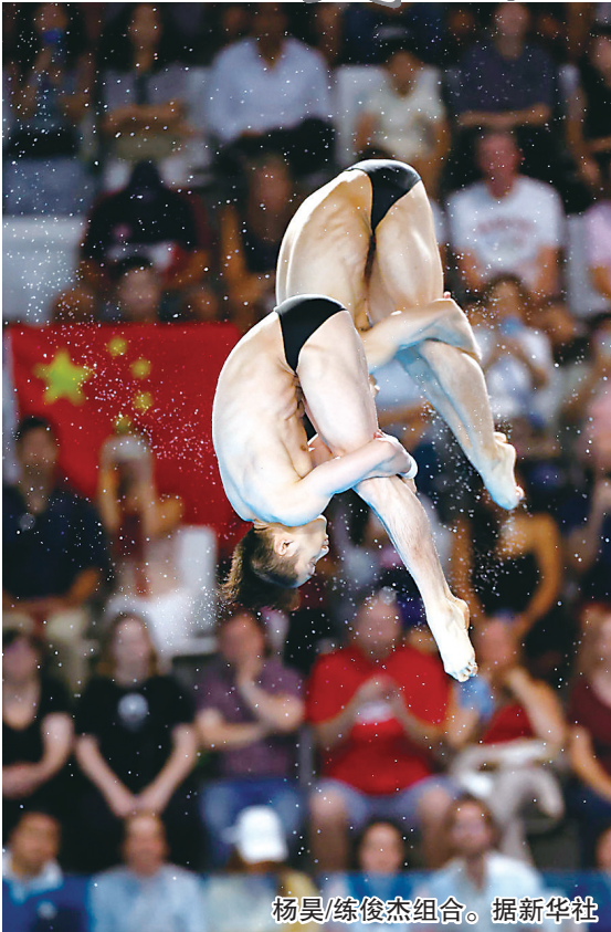
杨昊/练俊杰组合。据新华社

7月29日,在巴黎奥运会跳水男子双人10米台比赛中,中国组合杨昊/练俊杰夺得金牌。这是中国代表团在本届奥运会获得的第4枚金牌。此番出征,杨昊/练俊杰肩负着为梦之队夺回该项目金牌的重任。他们也没有辜负期望,在难度系数3.6的第五跳中,更是拿下了91.80的高分。最终,两人以总分490.35分的超大优势力压英国和加拿大组合拿下冠军。