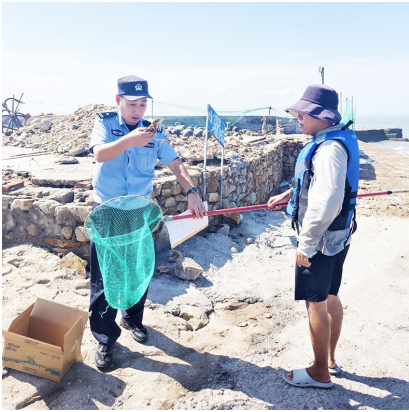
民警在码头救助受伤的小鸟。