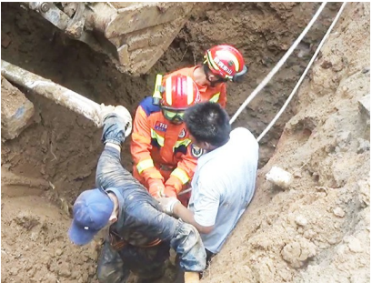
被掩埋的工人被救出。

本报7月28日讯 7月26日下午3时40分许，开发区消防救援大队接到求救电话，峨眉山路小学北门外道路，