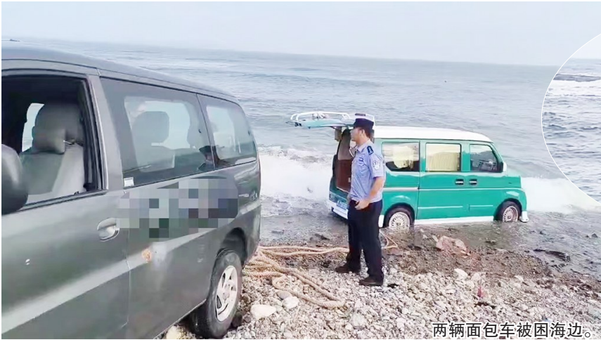
两辆面包车被困海边。