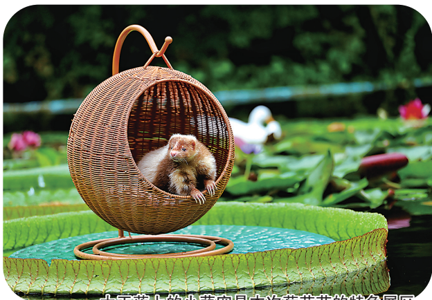
大王莲上的小萌宠是本次荷花节的特色展区。