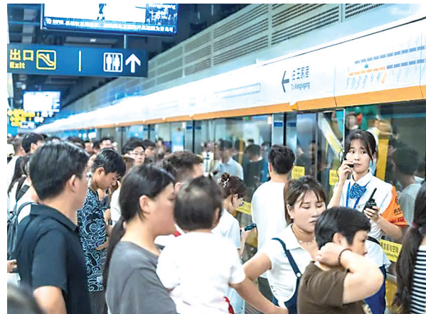
▲ 地铁成出行主力军。 ◀ 机场客流创新高。