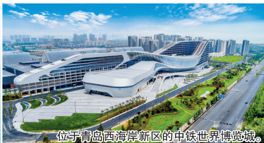
位于青岛西海岸新区的中铁世界博览城。

大叶藻等逐年增多，湾内海域栖息着260余种动物、28种植物，鱼鸥成群，生机盎然。灵秀海岛风情也更加凸显。灵山岛森林覆盖率达80%，岛体及周边2500公顷海域生物多样性丰富。通过海岛生态修复，开展垃圾集中处置、污水集中处理及蓄水涵林、岸线整治、陆岛交通码头改扩建工程，完善了岛上的基础设施，居民生活便利性得到明显改善。通过新建城市绿道22.4公顷，新增亲海广场2.85公顷，配套完善公共服务设施1.17公顷，“车行观海、骑行慢道、亲水步道、观景平台、休憩驿站、视觉走廊”的沿海要素在青岛的岸线上集中显现。随之而来的便是带动产业繁荣，生态经济结构初见雏形。如今，影视、会展等产业蓬勃发展，带动东方影都、世界博览城等百亿级项目成功入驻，“碧海银滩”也是金山银山，成为青岛落实经略海洋战略的重要支点。据悉，2023年青岛市海洋生产总值再创新高，达到5181.3亿元，同比增长6.5%，居全国第三位。