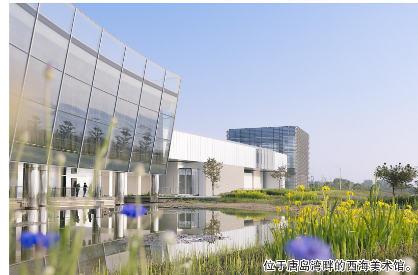
位于唐岛湾畔的西海美术馆。

55家涉海科研机构、61个部级以上高端研发平台、海洋高端科创平台数量位居全国第一……在青岛雄厚海洋经济发展的背后，海洋科创“大脑”可谓功不可没。科技创新平台作为集聚创新要素、汇聚创新人才和开展科技创新的重要载体，是原始创新的“策源地”。在海洋高端科创平台数量位居全国第一的基础上，青岛正进一步推进一批海洋高能