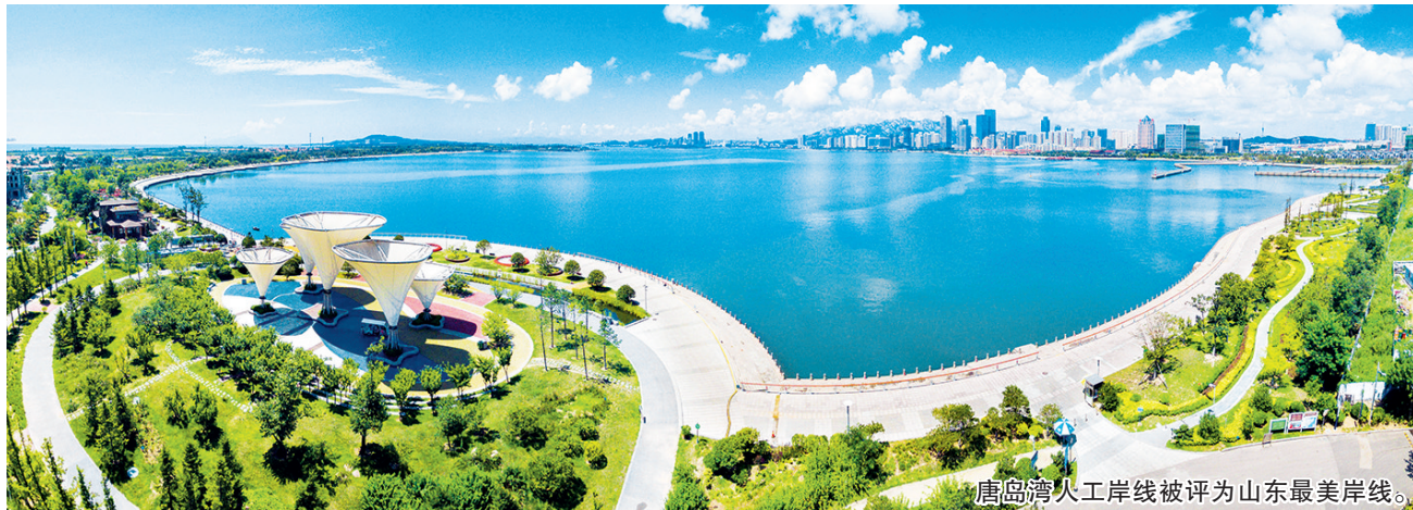
唐岛湾人工岸线被评为山东最美岸线。