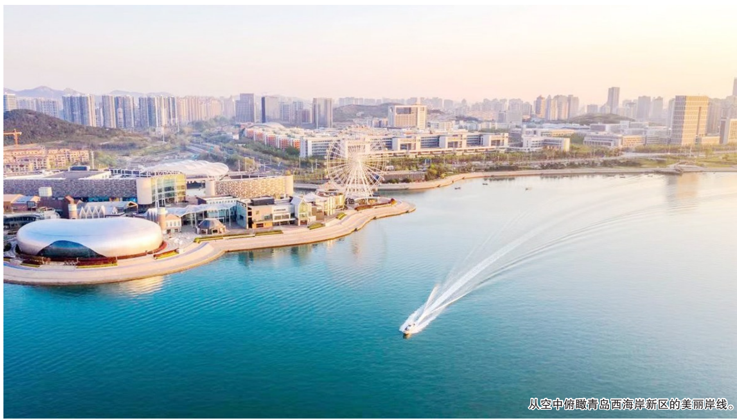
从空中俯瞰青岛西海岸新区的美丽岸线。