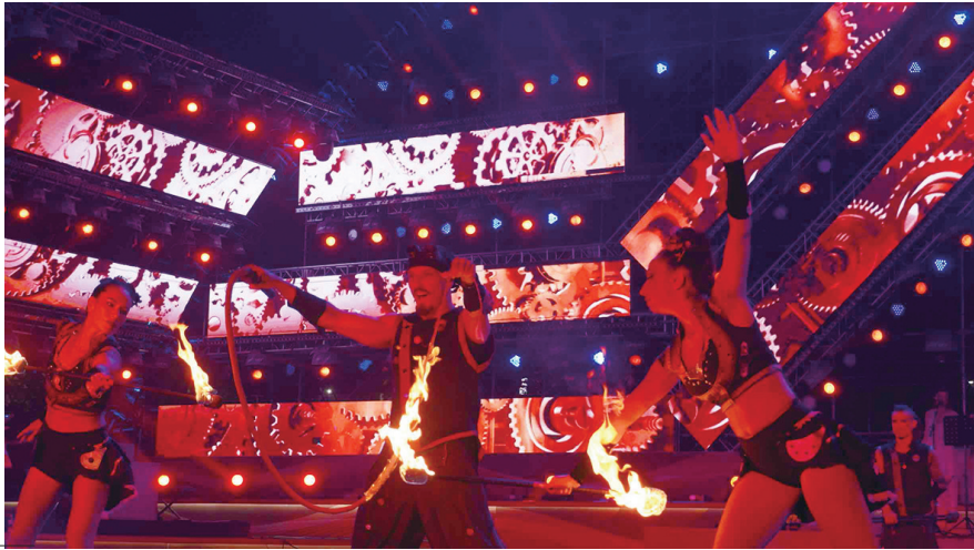
《酒秀》演出。

近日,全国首部大型啤酒主题演艺秀《酒秀》亮相第34届青岛国际啤酒节,来自俄罗斯、哈萨克斯坦、白俄罗斯等10个国家的百余名艺术家共同参与,在金沙灘啤酒城的中心舞台上演了一场国际范儿的表演。《酒秀》是为青岛国际啤酒节量身打造的新型文旅演艺秀。去年,全国首部大型啤酒主题演艺秀——《酒秀》在啤酒节期间亮相,观众反应热烈。今年,《酒秀》进行重磅改版升级,并以全新面貌呈现在观众面前。改版升级后的《酒秀》在创意编排、舞台舞美和灯光视效制作方面有了全面提升,演出阵容更加庞大。