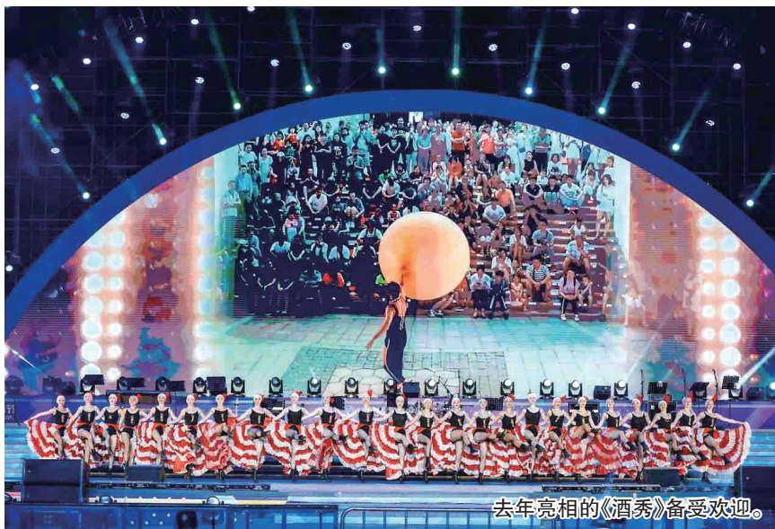
去年亮相的《酒秀》备受欢迎。