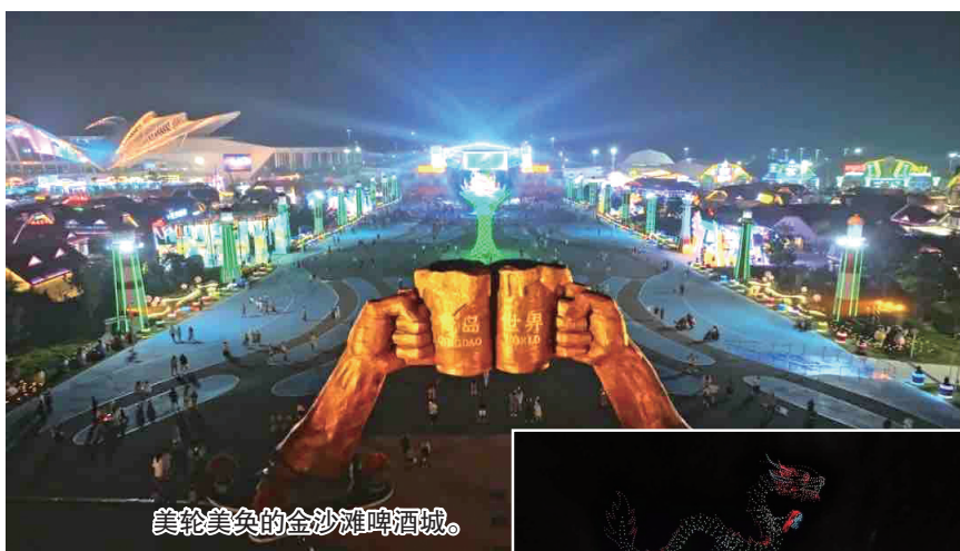
美轮美奂的金沙滩啤酒城。