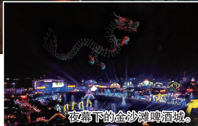
夜幕下的金沙滩啤酒城。

去年，全国首部大型啤酒主题演艺秀——《酒秀》在啤酒节期间亮相，并获得成功。本届啤酒节，《酒秀》将以全新的演出形态，国际化的演出阵容，高水平的舞台声光电、特效和光影制作，沉浸式的观赏体验，赢得观众和业界的赞誉。王功介绍，升级后的中心舞台将通过变幻的舞美打造出全新的演出空间，给人以耳目一新的感觉。重磅改版升级的《酒秀》在创意编排、舞台舞美和灯光视效制作方面都有了全面提升，演出阵容更加庞大，国际化程度更高，邀请了来自俄罗斯、哈萨克斯坦、白俄罗斯、墨西哥、