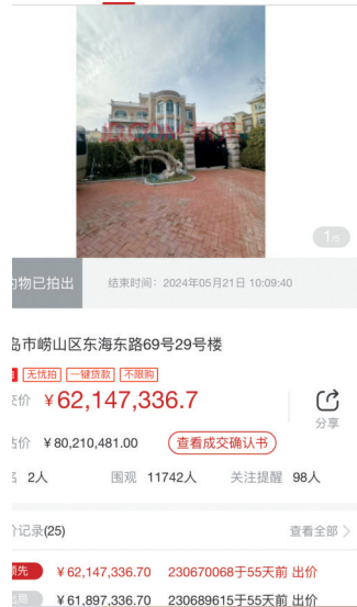
东方之珠花园一套别墅以6214万元价格拍出。