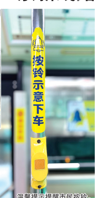
溫馨提示提醒市民按鈴。

本報7月16日訊 公交不需“站站停”，開啟出行“加速度”。16日，618路、639路、671路、679路正式實施“響應式公交”——上車招手+下車按鈴，為乘客提供更便捷體驗。