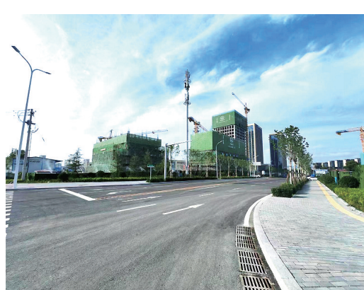
桐柏路拓寬工程項目竣工通車。

該道路建成通車後，將有效連通已建成道路成網成環，提高車行效率，改善居民出行環境，為百洋健康科技園及周邊的居民出行提供便捷，對均衡周邊路網流量、提高路網整體通行效率發揮重要作用。據了解，今年我市計劃打通規劃十路、東側規劃路、鏡湖路等5條未貫通配套道路，目前，規劃十路、東側規劃路已完工，大港緯三路和