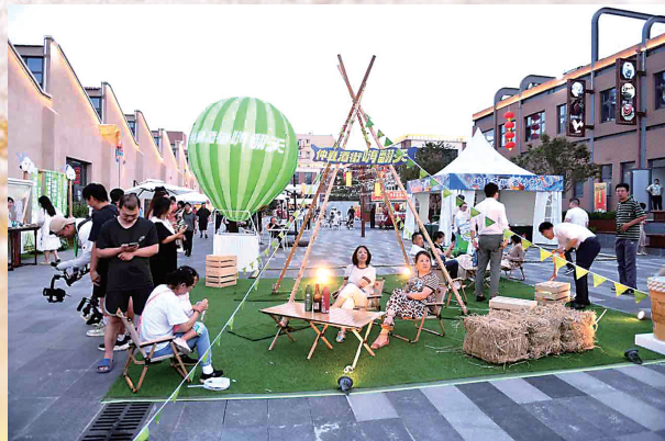
市民盡情享受夏日啤酒盛宴。

本報7月14日訊 13日晚，2024青島登州路啤酒街開街暨市北區啤酒音樂節啟動儀式舉行，在煥新起勢的青島文化市場，登州路打開新大門，以“仲夏酒街嗨翻天”為主題，拉开了今夏啤酒狂歡的序幕。本次開街慶典新增多個喜聞樂見的互動環節和體驗，為市民遊客奉獻了一場活力激情的夏日狂歡盛宴。