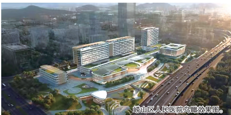
嶗山區人民醫院鳥瞰效果圖。

嶗山區人民醫院總用地面積為72797.7平方米，總建築面積229870平方米，其中地上建築面積125000平方米，地下建築面積