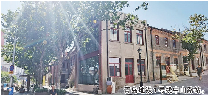
青岛地铁1号线中山路站。