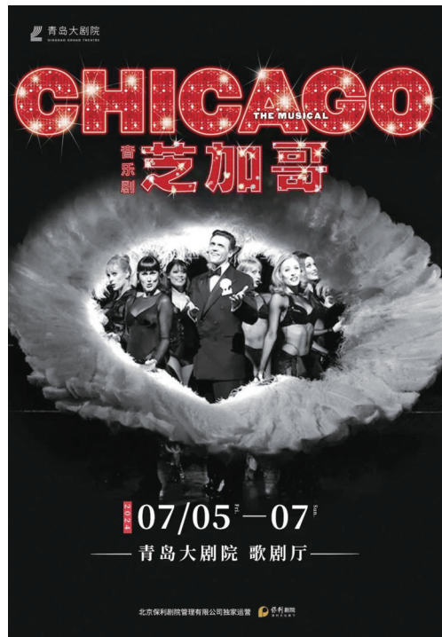
原版《芝加哥》周末岛城上演。

提起阿凡提,许多人会立刻浮现他骑着小毛驴的经典形象。青岛话剧院的儿童剧《阿凡提》7月6日将在永安大戏院上演。这部剧融汇了经典童话故事阿凡提的元素,将观众熟知的“卖树荫”、“种金子”和“仙兔送信”的传说连接,以轻松愉快的风格,为孩子们演绎一个个妙趣横生的斗智故事。