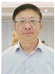
朱国顺 中国晚报工作者协会执行会长、学术委员会主任

晚报在我国的文化建设上发挥着很大的作用。山东作为中国文化标杆性的省份，此次文化新闻分会，晚报同仁齐聚青岛更是令人期待，希望与青岛的山海文化、山东的齐鲁文化碰撞出不一样的火花，带来不同启迪，让全国晚报成为中国文化建设的生力军。