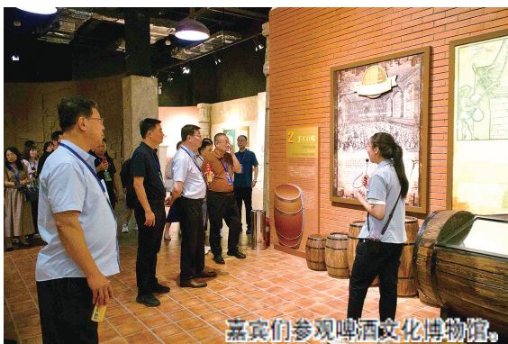
嘉宾们参观啤酒文化博物馆。