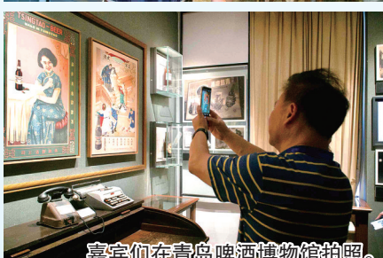
嘉宾们在青岛啤酒博物馆拍照。