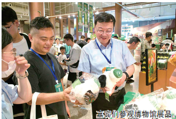
嘉宾们参观博物馆展品。