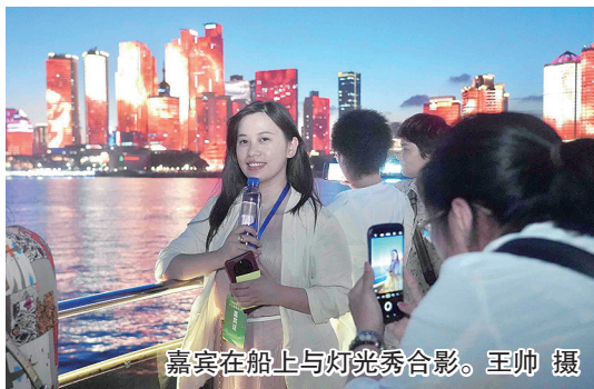
嘉宾在船上与灯光秀合影。

海上观青岛，越夜越美丽。全国晚报总编青岛调研活动·中国晚报工作者协会文化新闻分会2024年年会暨会长会议今日举行，昨晚，来自全国30多家报社的总编辑、文化新闻相关负责人相聚在奥帆中心，沉浸式体验“夜游浮山湾”，观赏灯光秀，感受青岛时尚活力的打开方式。