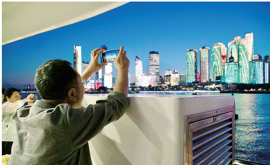
嘉宾在船上记录灯光秀精彩瞬间。