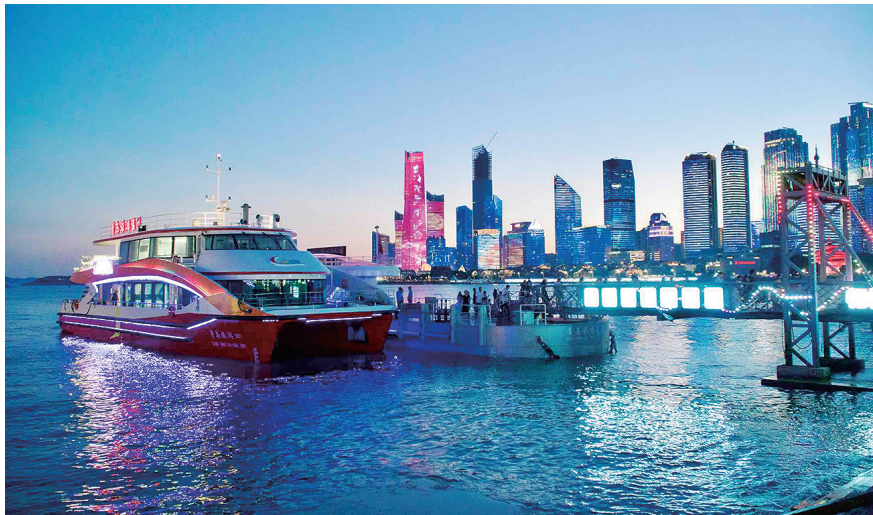
当晚奥帆中心灯光秀美景。栾丕炜 摄