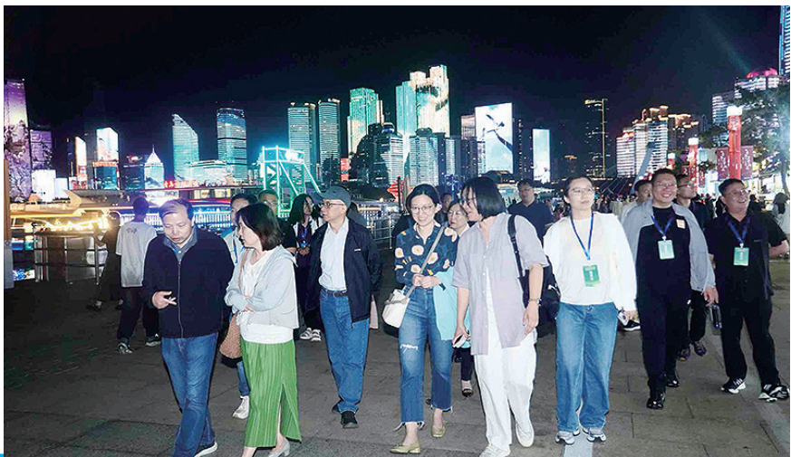
嘉宾漫步奥帆中心。