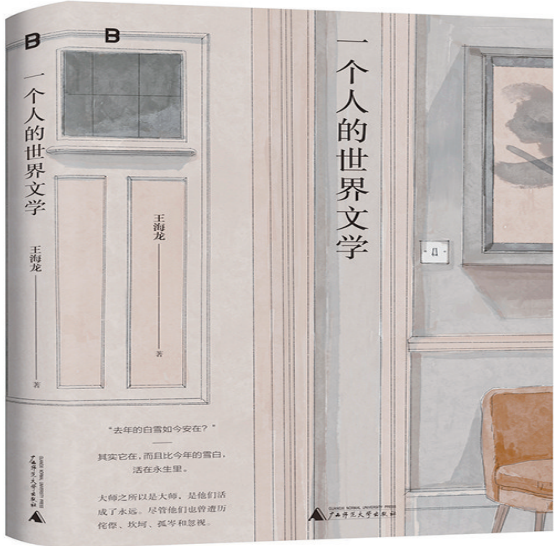
《一个人的世界文学》王海龙 著 广西师范大学出版社 2024年5月 出版

旅美作家、人类学家、比较文化学者王海龙,实地探访世界级博物馆与名人旧居,拜访名家后辈,以第一手资料撰写《一个人的世界文学》,讲述着文学艺术大师之所以成为大师巨匠鲜为人知的心路历程。