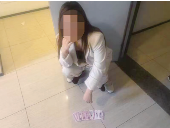
苏某某指认发放的小广告。

本报6月14日讯 6月14日，青岛市公安局持续强化对街面各类非法小广告的打击力度，加强源头管理，斩断传播链条。5月接、处小广告警情环比下降34%。