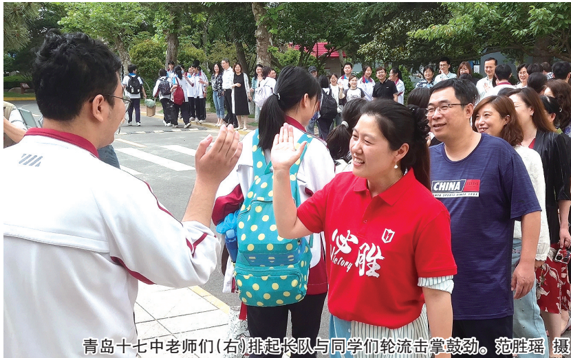
青岛十七中老师们(右)排起长队与同学们轮流击掌鼓劲。

门口、在小操场，在小湖边留下和同学、老师的合照，摆出可爱的姿势，甚至把老师“举高高”，欢声笑语充满了校园。“一化北溟鱼”“高考加油”“前程似星海”……同学们还在学校为他们准备的