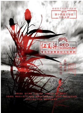
《红高粱》《马向阳下乡记》为青岛赢回两次“文华大奖”。