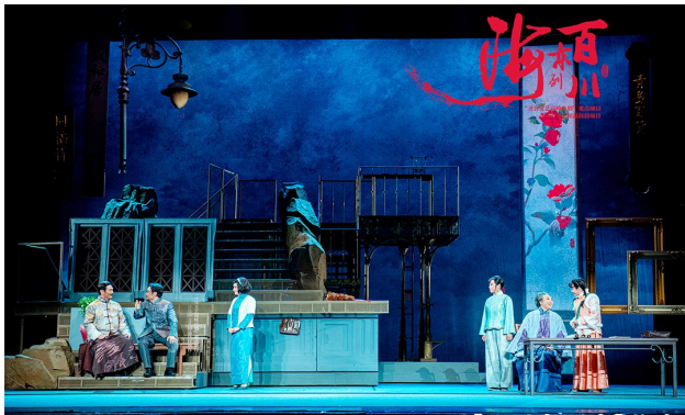
5月28日、29日，吕剧《百川东到海》将在贵州省国际会议中心剧场上演。