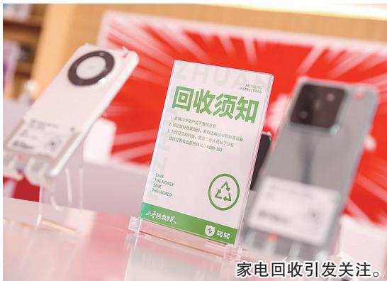
家电回收引发关注。

青岛消费品补贴资金从哪里来？据介绍，充分发挥市场配置资源的决定性作用，用财政资金引导撬动社会资本，市财政将联合主要家电生产、家电销售企业，共同设立家电以旧换新补贴资金，其中市财政安排资金1亿元，带动家电生产企业和销售企业分别出资2500万元，通过政府支持、企业让利、线上线下融合等方式，调动各方积极性，激发消费活