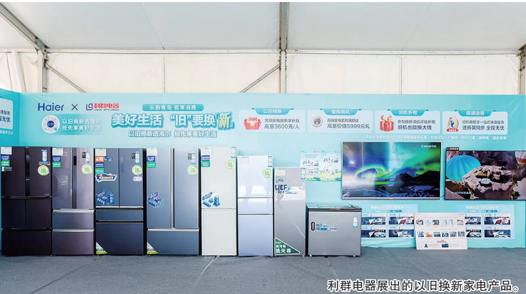
利群电器展出的以旧换新家电产品。