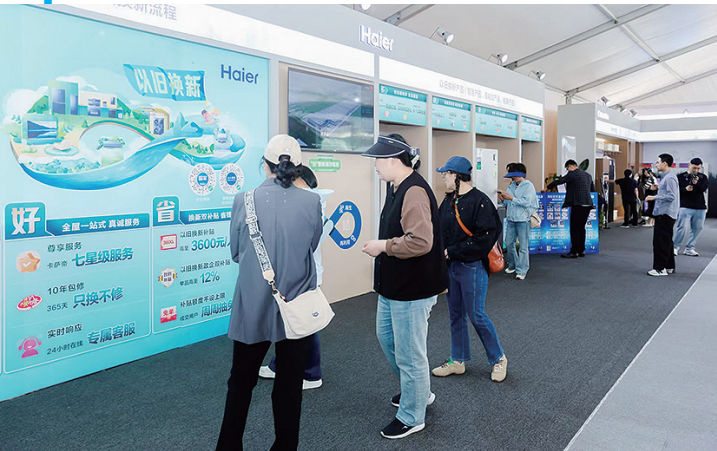
市民关注消费品以旧换新政策。

青岛是家电名城，拥有海尔、海信、澳柯玛等国内外知名品牌，2023年冰箱、冷柜、空调、洗衣机、电视等产量占全国总产量的9.6%。家电等再生资源回收体系建设完善。青岛也是消费大市，始终把恢复和扩大消费摆在优先位置，消费市场持续回暖向好，2023年社会消费品零售总额突破6300亿元、居北方城市第二位，汽车保有量超380万辆，电视机、电冰箱等耐用消费品保有量超2300万台，消费品以旧换新市场空间很大。通过以旧换新，推动绿色智能的高品质消费品更多进入居民生活，促进消费升级，释放消费潜力，畅通资源循环利用链条，加快形成新质生产力，推动经济高质量发展。