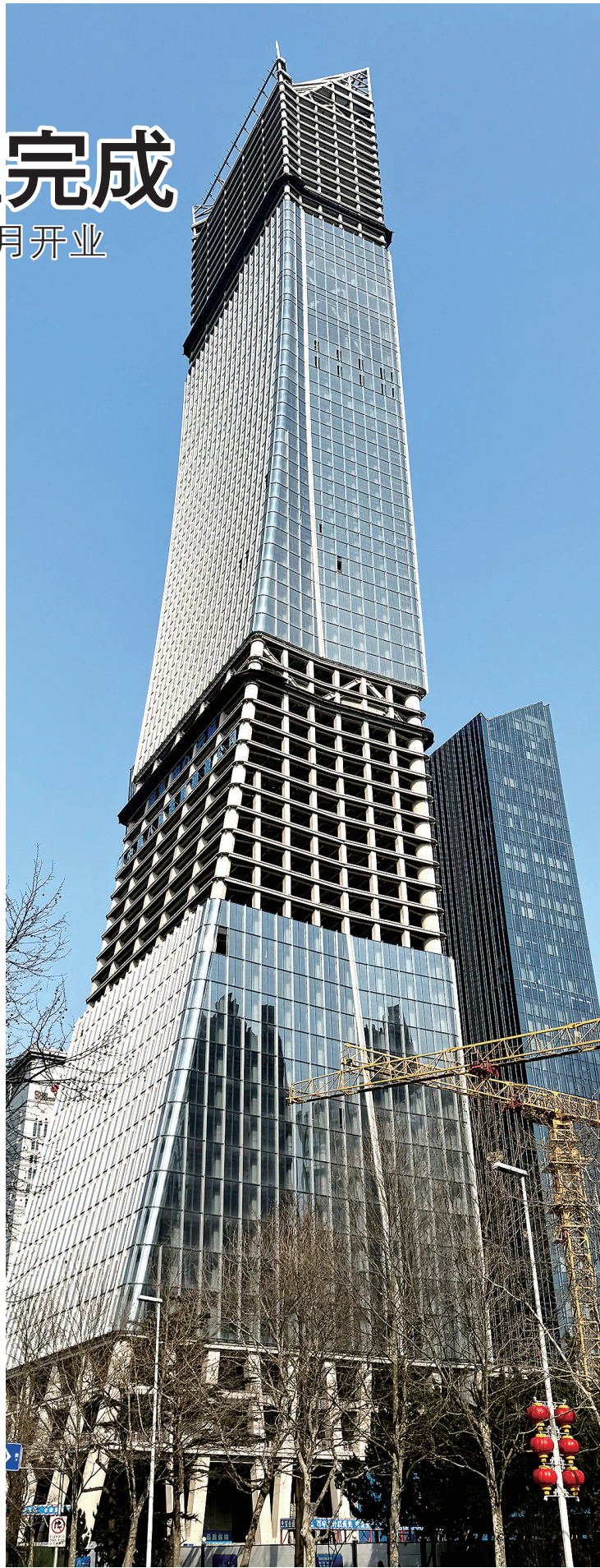
建设中的岛城第二高楼。