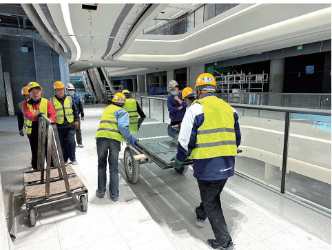
工人们正在紧张施工。