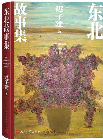
《东北故事集》 迟子建 著 人民文学出版社 2024年1月出版

了前言，他将海漭的小说称为“通俗小说”，并且认为“这本书无疑是古典主义的。”他把书中收录的小说大致分为三类：探案小说（《血灾》《极北之地》《时空画师》）、技术惊悚小说（《愿时间在此停留》《诡城》《土楼外的春天》）和历史科幻小说（《龙骸》《尽化塔》《走蛟》《江之怒》）。“悬疑、技术灾难、历史——海漭喜欢的创作主题并不怪奇，他只是一名在未来、现实和历史的时空夹缝中捕捉异常现象的观察者。”