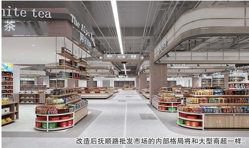
改造后抚顺路批发市场的内部格局将和大型商超一样。