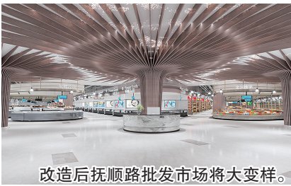
改造后抚顺路批发市场将大变样。

圾清运等工作已经开展。据悉,改造并未对市场的营业造成太大的影响。市场监管等部门积极靠前服务,不断加强与市场主办方的沟通协调,为涉及到的235家市场业户分三期搭建临时安置棚作为过渡摊位,截至目前第一批共102家业户已在过渡摊位正常经营,市场改造进程有序推进。