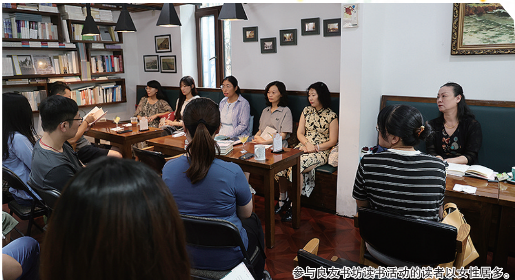
参与良友书坊读书活动的读者以女性居多。

截 止到2023年底,在青岛市图书馆持证读者中,女性读者占总数的58.30%,男性读者占总数的41.70%。这样的数据并不是青岛独一份,在杭州等地发布的数据中,也都是女性读者比例大于男性读者。