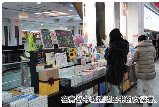
在青岛书城选购图书的女读者。

品集:她和她的黄金时代》《南来北往》《繁花》《一百年,许多人,许多事:杨苡口述自传》《提升幸福力:改变你一生的30个心理学效应》《深度思维》等等,多门类的图书都以75折进行优惠销售。此外,“三月春光恰如你”生活类图书书展也同期开展,展出图书以75折进行优惠销售。