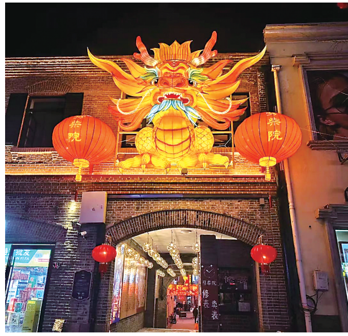
龙盘上街里主题彩灯之一位于劈柴院。

极扇展演。2月10日至2月12日，“2024春节太平晓钟 福道崂山敲钟祈福活动”将在仰口太平宫举行，每日上午9:00开始，为前100名敲钟的游客赠送“苹果”和“福”字挂件，为游客送上“平安幸福”。2月17日，在华严游览区文化广场举办“展非遗之韵 迎崂山之春”首届华严市集暨新春民俗文化活动，设置非遗文创展销、非遗项目展演、非遗文化交流、游戏互动体验和网红拍照打卡五大板块，为国家、省、市、区非遗项目提供文化展示平台，邀请非遗传承人现场展演展示非遗技艺、文创艺术、特色产品，现场展示丰富多彩的传统佳节民俗文化。正月初一当天，在九水游览区将为前50名入园游客发放新年纪念品、邀游客一起写福语、挂福枝，一起度过福气满满的新春。温馨提示：崂山九水游览区客服中心正在进行改造提升，施工期间无法提供停车服务，建议广大游客选择公共交通出行。