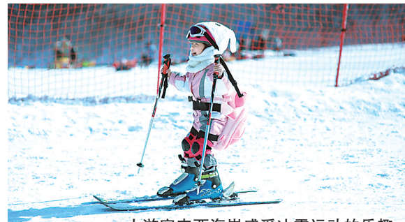
小游客来西海岸感受冰雪运动的乐趣。