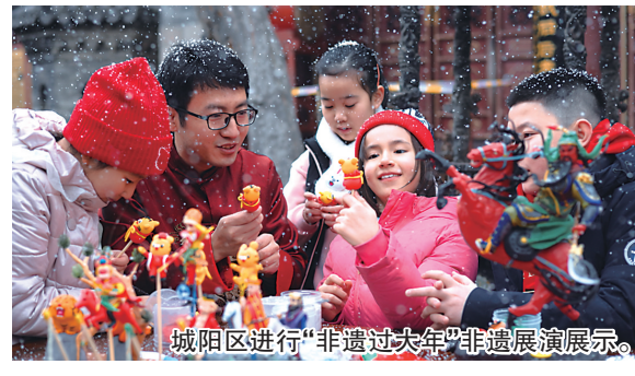
城阳区进行“非遗过大年”非遗展演展示。

集结新区的文旅资源，新区文化和旅游局特意推出“来西海岸过大年”六大春节主题文旅产品，为市民游客的冬季及春节假期出游提供更多选择。六大春节主题文旅产品分别为龙腾西海岸·年俗年礼、龙驰西海岸·冰雪狂欢、龙游西海岸·岸线风情、龙行西海岸·山野冬韵、龙品西海岸·研学探索、龙悦西海岸·康养秘境。龙腾西海岸·年俗年礼即邀请市民游客前往铁山街道杨家里田园综合体、齐鲁之间生活村、融创·阿朵花屿、海青镇北茶商街、中日韩消费专区电商体验中心等，置办年货，感受春节的仪式感。在藏马山滑雪场、月季山滑雪场、西海岸滑雪场，市民游客可尽情滑雪、玩雪，体验冬日里的冰雪狂欢乐趣。冬季，环岛路的热闹喧嚣退去，此时正是自驾、听海、赏景的绝佳时机。唐岛湾公园、海军公园、“深蓝之光”栈桥等地标在冬日展现出别样的风情，令人心旷神怡。