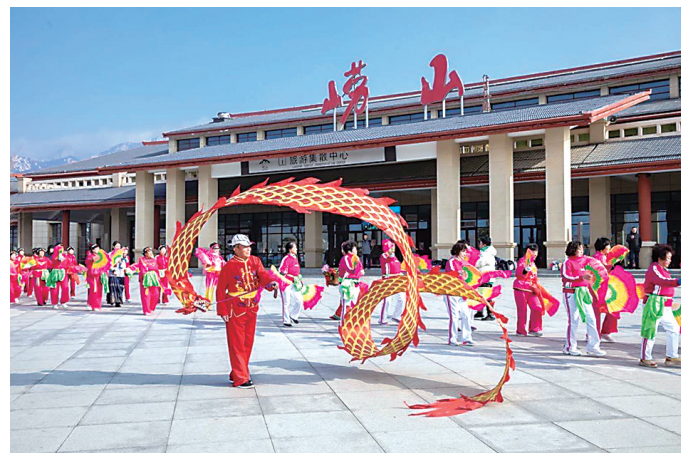
崂山风景区多种活动热闹喜庆。