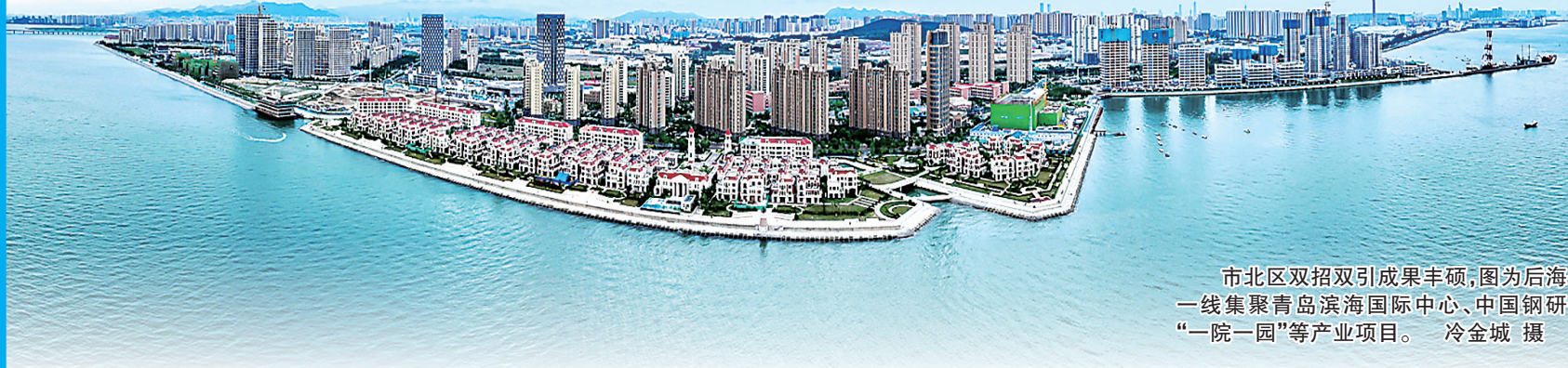
市北区双招双引成果丰硕，图为后海一线集聚青岛滨海国际中心、中国钢研“一院一园”等产业项目。冷金城 摄

城市的发展进阶，总会聚集更强大的动能、实现更精彩的跃迁和托举起更高质量的民生，方能开启更加美好的未来。2023年是全面贯彻党的二十大精神开局之年，市北区牢牢把握高质量发展首要任务，发力扩大内需、招商引资、城市更新、服务升级、民生保障“五大战场”，一批事关长远的重大基础设施、“2+6”特色产业和城市更新项目落地见效，一批纾难解困的惠民措施提标扩面，繁荣美丽幸福的现代化国际城区建设迈出坚实步伐。