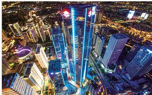
市北区夜经济活跃，图为中央商务区。崔超 摄