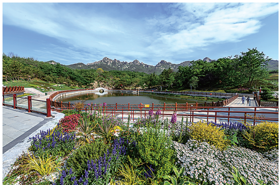
浮山森林公园文翠湖。

新征程已然起航，唯有奋斗为本。市北区将笃行不怠，扛牢主城担当，奋力谱写中国式现代化市北篇章。观海新闻/青岛晚报/掌上青岛 记者于波 通讯员丁飞