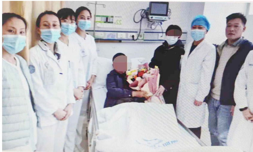
脑卒中患者康复出院。