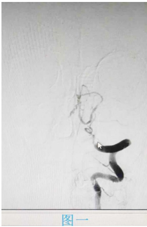
造影显示患者左侧椎动脉急性闭塞,远端无血流。