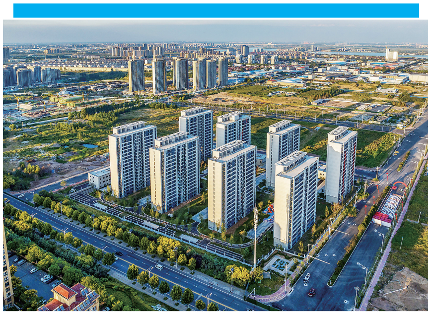
刘家岭、匙家庄旧村改造项目安置区。

巩固提升“一城、一网、一平台”智慧停车管理模式,统筹停车设施“软件”“硬件”一体建设,全域增加停车配建,推进14个公共停车场项目,完成公共停车场8个,泊位5870个。完成经营性停车场联网共享18个,完成小区停车设施错时