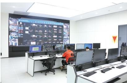
工作人员紧盯控制屏幕。