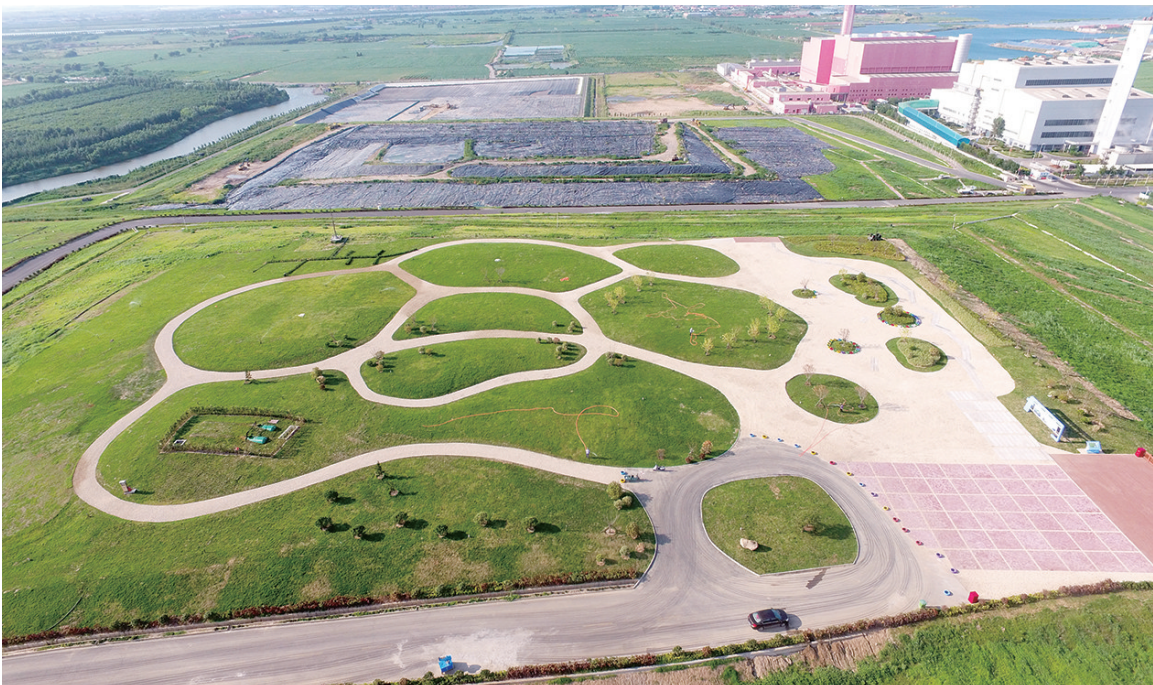
小涧西生活垃圾综合处置园区变身花园园区。

目前,小涧西生活垃圾综合处置园区已形成以焚烧发电为核心、厨余垃圾处理为补充、卫生填埋为保障的生活垃圾综合处理体系,实现了资源共享和污染物的集中控制,确保了园区内的废水和废渣零排放。从生活垃圾填埋转为飞灰固化填埋,从生态修复再到碳减排及能源化,生活垃圾卫生填埋逐步退出“主