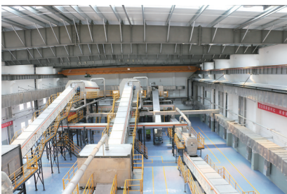
生活垃圾预处理车间。