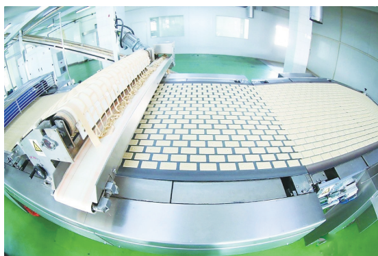
青食钙奶饼干生产线。

华琨生物是一家以技术为驱动专注小浆果(蓝莓、蔓越莓、酸樱桃)深加工的创新企业,是国内领先的小浆果干生产企业,所生产的GLOZI/果乐滋(小浆果大营养)品牌小浆果干行销欧盟和国内,服务近百家世界食品企业。华琨与种植企业通过战略结盟的方式建立起长期、稳固的合作关系,确保原料供应,已在青岛、江苏、辽宁、安徽等主产区发展了多家实力强大的原料战略合作伙伴。