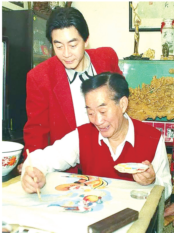
六小龄童与父亲六龄童。

2024年恰逢“绍剧宗师”六龄童100周年诞辰，为了纪念这位“章式猴戏”开创者，绍剧名家、著名表演艺术家六小龄童亲自撰稿，书写父亲六龄童与戏曲交织的一生，出版了《金猴宗师：我的猴王父亲六龄童》，“通过这本书的描述，大家可以知道绍剧的历史，我们家族四代人如何与孙悟空结下了不解之缘。最重要的还是希望读者能从这本书里，感受《西游记》的魅力和戏曲艺术的传承，去思考如何做得更好。”