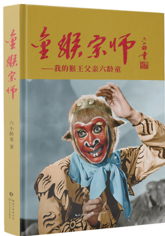
《金猴宗师：我的猴王父亲六龄童》 六小龄童 著 长江文艺出版社 2024年1月出版