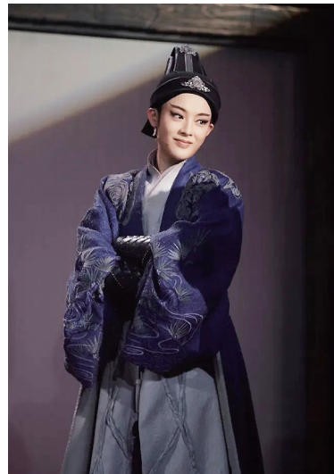
陈丽君在《新龙门客栈》中的扮相。