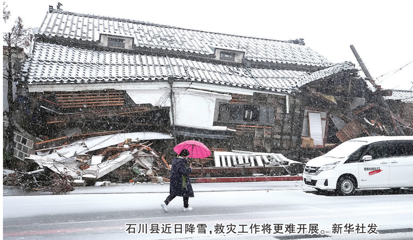
石川县近日降雪,救灾工作将更难开展。