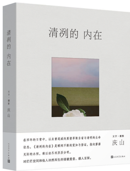
《清冽的内在》 庆山 著 人民文学出版社 2023 年 12 月出版

庆山全新散文集《清冽的内在》近日由人民文学出版社出版,本书记录了庆山 2019—2023 年间的日常生活和感悟。庆山坦言:“人至中年之后,我有一些时间用在休息上。在有强度的工作之后,感受到身体需要被照顾和关注。适当的山洞静修有其必要,是对下一轮翻山越岭以及搬砖建塔的准备。” 这本书像是一次休息,一次准备。庆山希望读者“对自己的生命有一种相信”,相信发生过的会“在某处安放”,“未来的事也已在某处等待”。