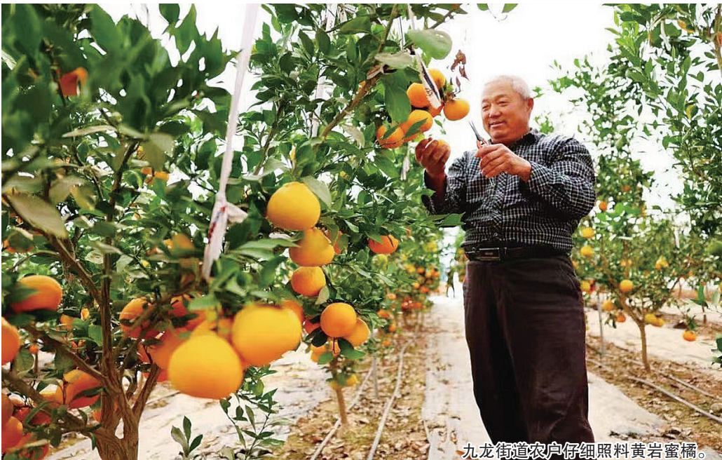
九龍街道農戶仔細照料黃岩蜜橘。