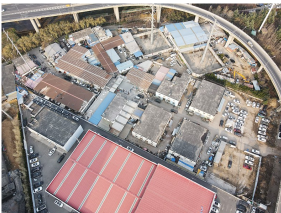
黑龙江路 598 号“插花地”整治前。