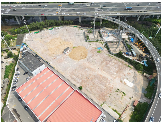
黑龙江路 598 号“插花地”整治后。