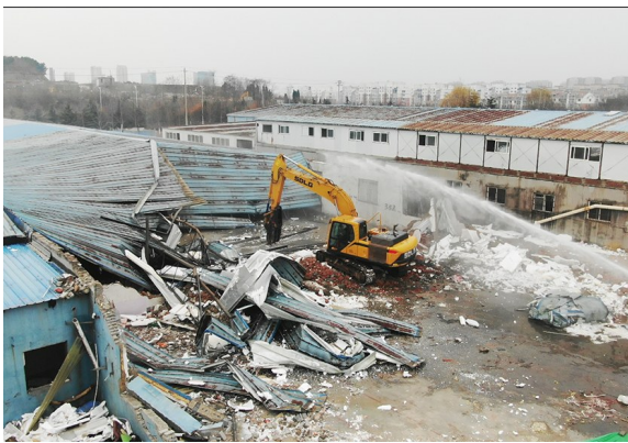
崂山区综合行政执法局组织拆除深圳路两侧园艺场违建。

处,新增违建防控见到明显成效。二是与市自然资 源和规划局、市财政局联合制发《青岛市违法建设 认定和处置工作规程(试行)》,违建认定处置更加精 准精细。今年全市严肃查办各类违建案件 600 余 件,执法部门重拳治违形成强力震慑。