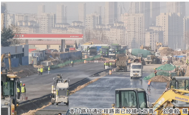
枣山路打通工程路面已经铺上沥青。

枣山路是连接李沧区和崂山区的重要道路，中间一段多年来一直是一条6米宽的小路，双向只有两车道，道路基础设施老旧。随着李沧区经济社会发展，枣山路狭窄、拥堵导致周边区域经济发展引擎动力不足，群众要求改变城市面貌的呼声十分强烈。今年2月，李沧区启动了枣山路打通工程(李沧区段)项目。这一项目西