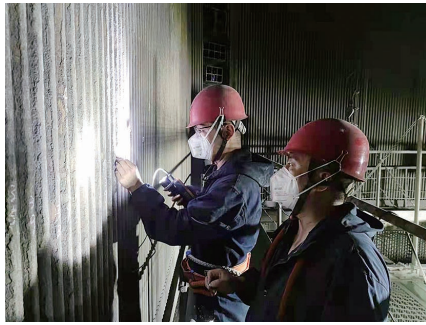
查看设施设备情况。