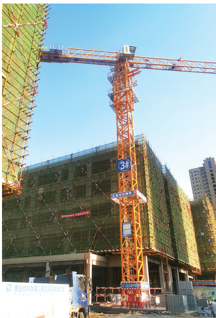
浮山学校正在紧张施工。

1.2万平方米，为高昌路后续打通项目（科苑纬四路—青山路）顺利开工扫清障碍。预计道路建成后，将解决多年以来崂山区与李沧区之间联通不畅的问题，极大提高崂山区和李沧区车辆通行效率。