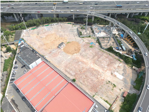
黑龙江路598号地块‘插花地’已完成场地平整。