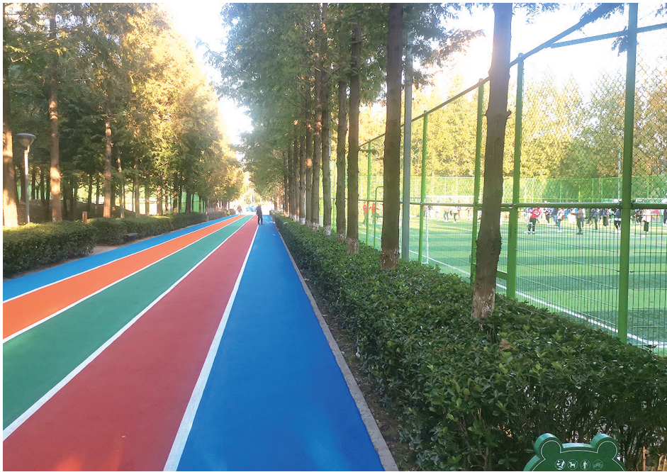
深圳路体育公园扩容升级。

崂山区革命烈士陵园周边、深圳路以西、高昌路以北区域也是“840 重点片区”，同时还是崂山区和李沧区的“插花地”，占地182亩，存在违法建设6.3万平方米。此处区域整体属东韩社区北山，多为中韩和东韩社区无手续砖混房和板房，违建已经存在20多年，主要涉及厂房、仓库、汽车修理厂等经营业户40余家。今年8月底，结合百日攻坚行动，崂山综合执法局联合中韩街道对青山路南片高昌路断点北侧违法建设进行拆除清理，共拆除违建