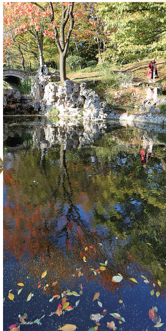
湖水中的落叶和倒影是最美的秋天。