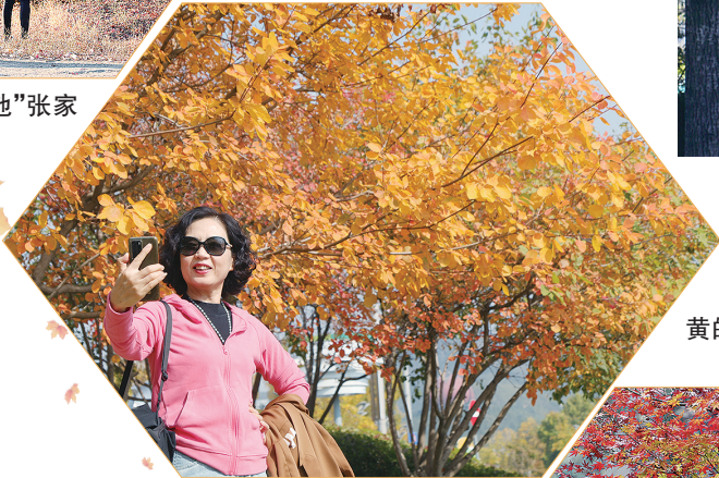
游人在世博园金黄的树叶前自拍。