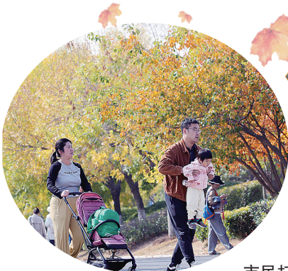
市民打卡世博园赏秋景。