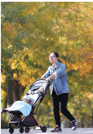
八大关景区秋景美如画。