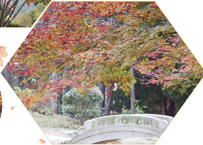
中山公园枫叶红黄绿三色相接。