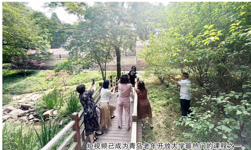
短视频已成为青岛老年开放大学最热门的课程之一。