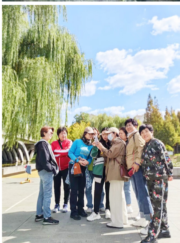
老年开放大学学员在公园采风。