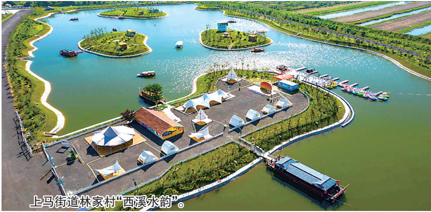
上马街道林家村“西溪水韵”。

本报10月19日讯 茂密的树林，清澈的湖水，在水中的小岛上，扎着一个个帐篷，游客们一起吃着烧烤，欣赏四周的美景。入夜，灯光开启，吹着晚风，相当惬意。这里就是位于上马街道林家村的西溪水韵。近年来乡村旅游持续走热，位于城阳区上马街道的林家村因地制宜，新建一处乡村旅游打卡地“西溪水韵”，把“凉资源”变“热流量”，促进集体经济和村民收入双增长。