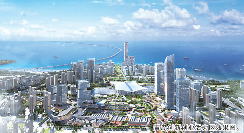
青岛创新创业活力区效果图。

山东大学在基础教育领域推动以山大附中为龙头的集团化办学模式，创新育人机制和培养体系，多次获得国家基础教育成果奖励，已发展成为引领山