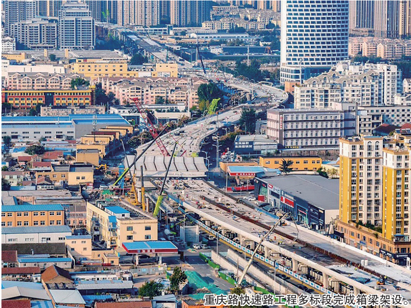
重庆路快速路工程多标段完成箱梁架设。

张作业，安全员不停巡视现场，混凝土泵车、钢筋切割机、吊车等机械在轰鸣中持续运转。主线桩基、承台、墩柱、盖梁已全部完成，预制箱梁架设完成70%，桥面系施工已全面铺开。