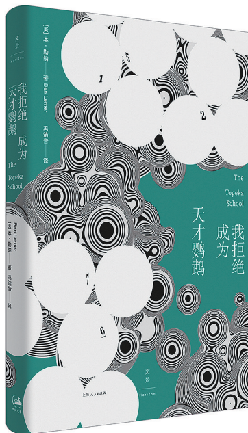
[美]本·勒纳 著 冯洁音 译 上海人民出版社 2023年9月 出版