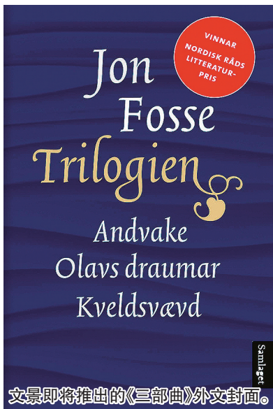
文景即将推出的《三部曲》外文封面。

如何尽快领略最新诺奖得主的文学风采?约恩·福瑟的两本戏剧选《有人将至》《秋之梦》早在2014年就有了中文版本,而他的小说《三部曲》《晨与夜》以及长篇代表作“七部曲”即将出版中文版。