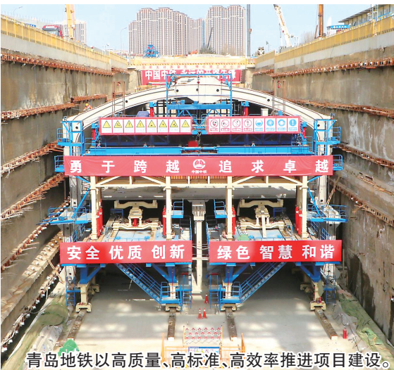
青岛地铁以高质量、高标准、高效率推进项目建设。

本报9月26日讯 管理创新,缔造企业创新基石;科技创新,成就企业技术高度;五小创新,培养企业“大国工匠”……26日,青岛地铁集团举办首届创新成果颁奖典礼,全面总结地铁集团十年来的创新工作,表彰优秀项目、单位、个人,展示创新成果,在全集团营造全员创新氛围,助力青岛地铁高质量发展,共有184项创新成果获表彰。