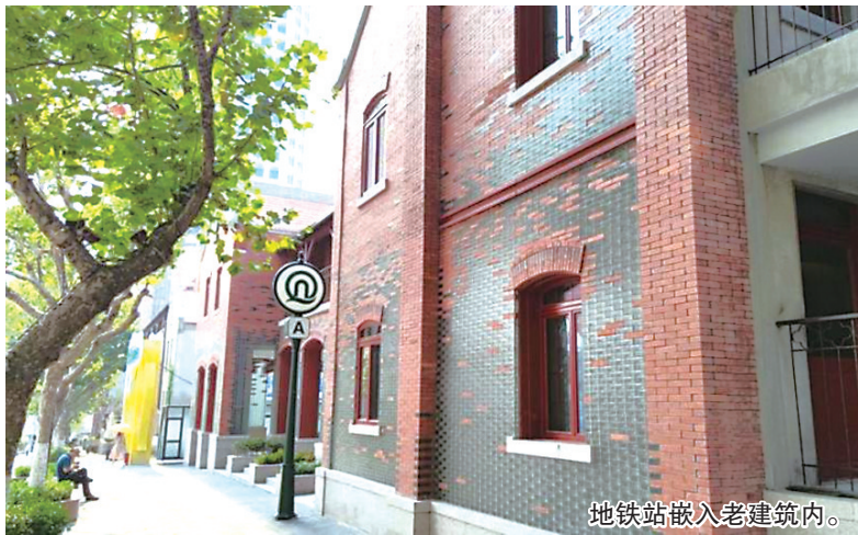
地铁站嵌入老建筑内。

一条中山路,半部青岛史。作为青岛老城区的核心街区,中山路沉淀了青岛城市商业文化的底蕴。随着城市更新与城市建设三年攻坚行动的实施,一度沉寂的中山路迎来了新生机。为延续建筑和城市特色风貌,青岛地铁集团积极响应加强历史建筑和传统风貌建筑保护工作的要求,由中建八局发展建设公司匠心打造地铁1号线中山路站风貌建筑修缮工程,使老建筑最大程度恢复原有历史风貌,并焕发出新的光彩。双节来临之际,焕然一新的老建筑将和广大市民和游客见面。