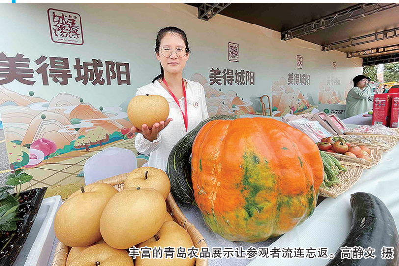
丰富的青岛农产品展示让参观者流连忘返。

本报9月24日讯 9月23日上午,城阳区惜福镇青峰村初心广场锣鼓喧天,以“庆丰收 促和美”为主题的2023年中国农民丰收节青岛市主会场活动在这里举行。让优秀农民代表登台受表彰,让农民成为欢庆自己节日的主角,成为本次中国农民丰收节庆祝活动的亮点。