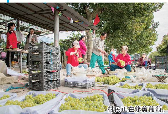
村民正在修剪葡萄。

本报9月24日讯 23日上午,2023年中国农民丰收节平度主会场活动在平度市大泽山镇“印象大泽”广场举行。据悉,平度市主会场活动是第37届大泽山葡萄节期间,又一场以农民为主角、以丰收为主题